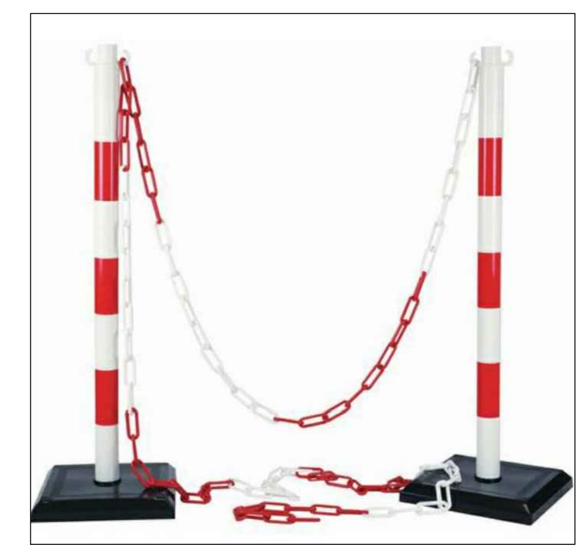
PARTICOLARE RECINZIONE TIPO

LEGENDA ● Supporto per ancoraggio catena divisoria — Catena divisoria