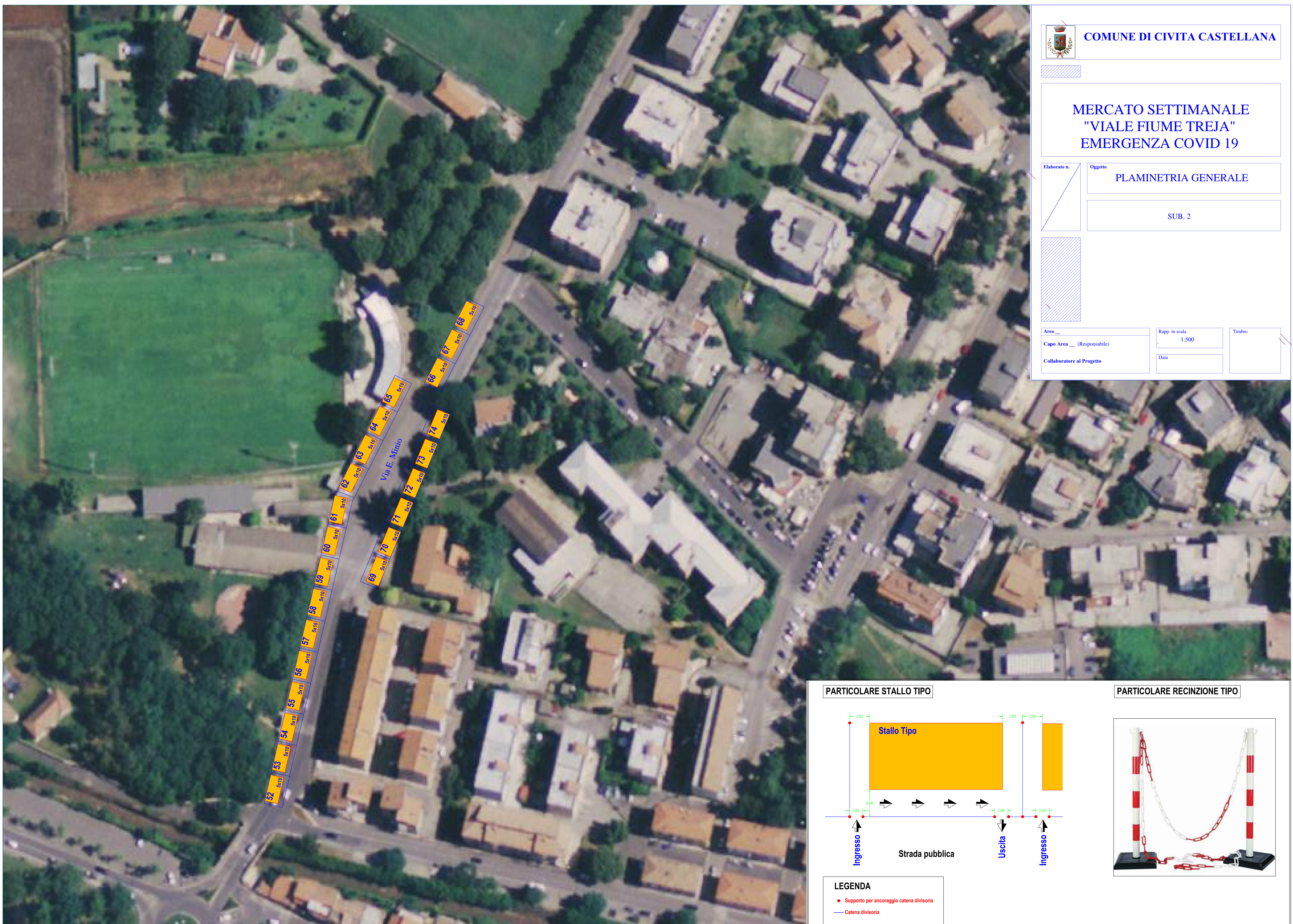
PARTICOLARE STALLO TIPO